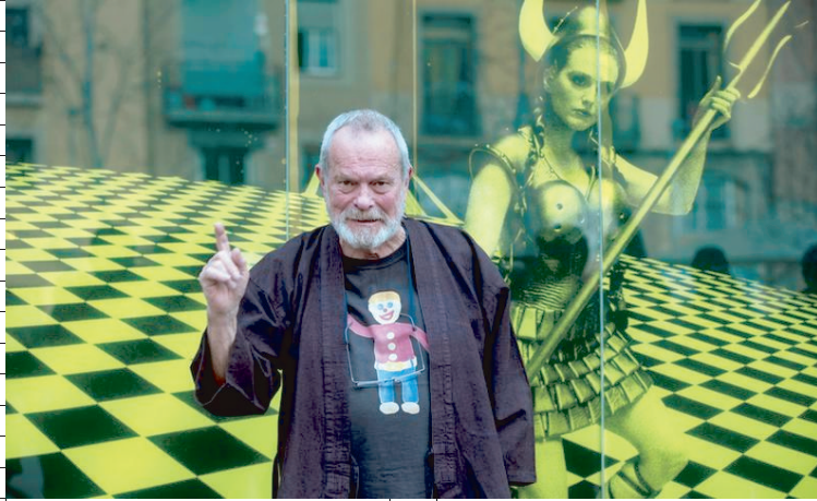
Anche il grande regista Terry Gilliam sarà tra gli ospiti del progetto

Un viaggio originale e innovativo che nell'arco di cinque week-end intreccia due mondi, la settima arte e le eccellenze enogastronomiche, in particolare olio e vino. Ecco "Umbria, i sapori del cinema", nuovissima iniziativa promossa da due assessorati regionali, Turismo e Agricoltura, con il coinvolgimento di AssoGal e curata dalla Rete dei cinque Festival del cinema umbri (Terni, Spello, Le Vie del Cinema di Narni, PerSo di Perugia e Umbria Film di Montone), dal 20 settembre al 3 novembre animerà numerose località con un format che schiera proiezioni gratuite di film italiani in cantine e frantoi, con ospiti e degustazioni, ma anche laboratori per le scuole, tour nei luoghi che sono stati set cinematografici, passeggiate e trekking. Per la presentazione a Palazzo Donini. «La sinergia tra gli assessorati - ha detto il vicepresidente della Regione e assessore all'agricoltura Roberto Morroni - vuole favorire un brand unitario per promuovere le eccellenze